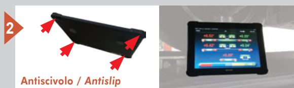
Antiscivolo / Antislip