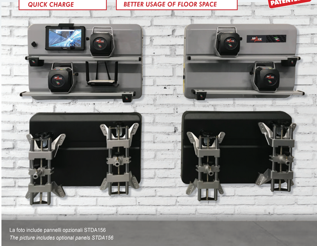
La foto include pannelli opzionali STDA156 The picture includes optional panels STDA156

Due pannelli a parete per l'alloggiamento e la ricarica del tablet e dei rilevatori. Two wall panels allow housing and recharging of tablet and measuring-heads. Zwei Wand-Panele mit Ablage und Ladestation des Tablets und der Messköpfe. Deux panneaux muraux pour rangement et charge de la tablette et des têtes. Dos paneles de pared para almacenamiento y carga de los captadores.