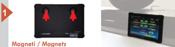
Magneti / Magnets