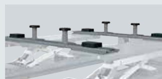
S 505 A2 (2 x kit)