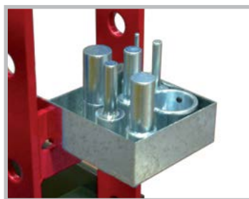
Ø 29 24 18 14 10 5 Kit punzoni Plugs Stempelset Kit de poinçons Juego de punzones