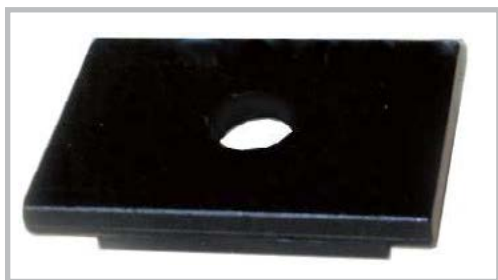
Piastra cacciaspine Press plate Abdrückplatte Plaque d'extraction Placa extractora de pasadores