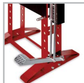
Comando a pedale Pedal drive Fusspedal Commande à pédale Mando a pedal