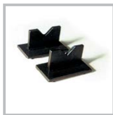
Prismi V-blocks Prismensatz Prismes à 'V' Prismas